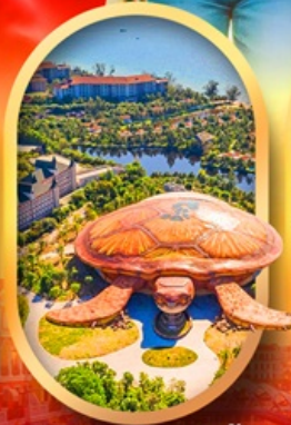
พิพิธภัณฑ์สัตว์น้ำ