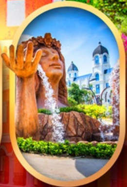
น้ำตกเทพพิสดวง