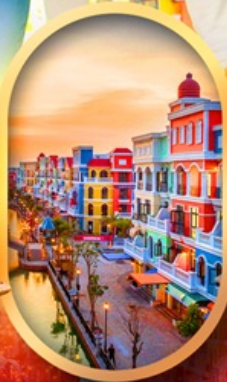
เวนิสแห่งเวียดนาม