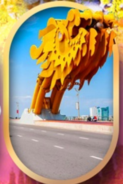
สะพานมังกรดานัง