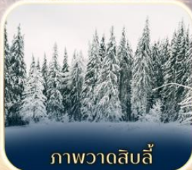
ภาพวาดสิบลี