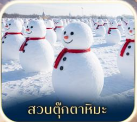
สวนตุ๊กตาหิมะ