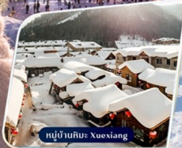
หมู่บ้านหิมะ Xuexiang