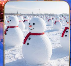
สวนตุ๊กตาหิมะ