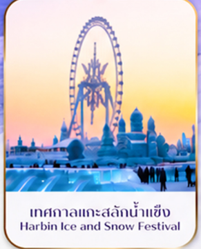
เทศกาลแกะสลักน้ำแข็ง Harbin Ice and Snow Festival