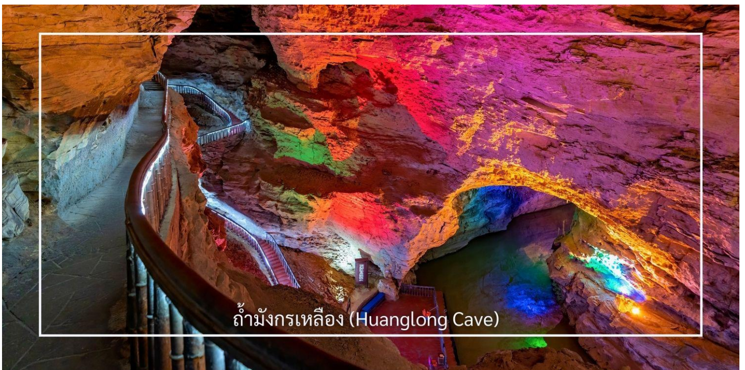
ถ้ามังกรเหลือง (Huanglong Cave)

ถ้ามังกรเหลือง หนึ่งในถ้ำหินงอกหินย้อยที่ยิ่งใหญ่และงดงามที่สุดของเมืองจางเจียเจี๋ย แหล่งท่องเที่ยวทางธรรมชาติที่ได้รับการยกย่องว่าเป็น “พระราชวังใต้พิภพ” แห่งดินแดนอุหลิงหยวน ถ้ำแห่งนี้มีโครงสร้างขนาดใหญ่ แบ่งออกเป็น 4 ชั้น ภายในประกอบด้วยห้องโถงกว้างใหญ่ ลำธารใต้ดิน บึงธรรมชาติ และแนวระเบียงหินที่ทอดยาวอย่างน่าตื่นตา ความมหัศจรรย์ของหินงอกหินย้อยซึ่งก่อตัวสะสมมาเป็นเวลาหลายล้านปี ได้รับการจัดแสงอย่างสวยงาม ช่วยขับเน้นรูปร่างแปลกตาให้โดดเด่น ราวงานศิลป์จากธรรมชาติ สัมผัสประสบการณ์ ล่องเรือชมแสงสีภายในถ้ำ โดยเรือจะนำท่านลัดเลาะไปตามสายน้ำใต้ถ้ำให้ท่านได้สัมผัสกับความยิ่งใหญ่ของธรรมชาติอันน่าอัศจรรย์ได้อย่างใกล้ชิด