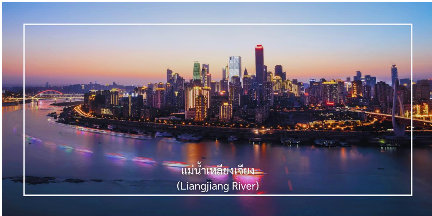
แม่น้ำเหลียงเจียง (Liangjiang River)