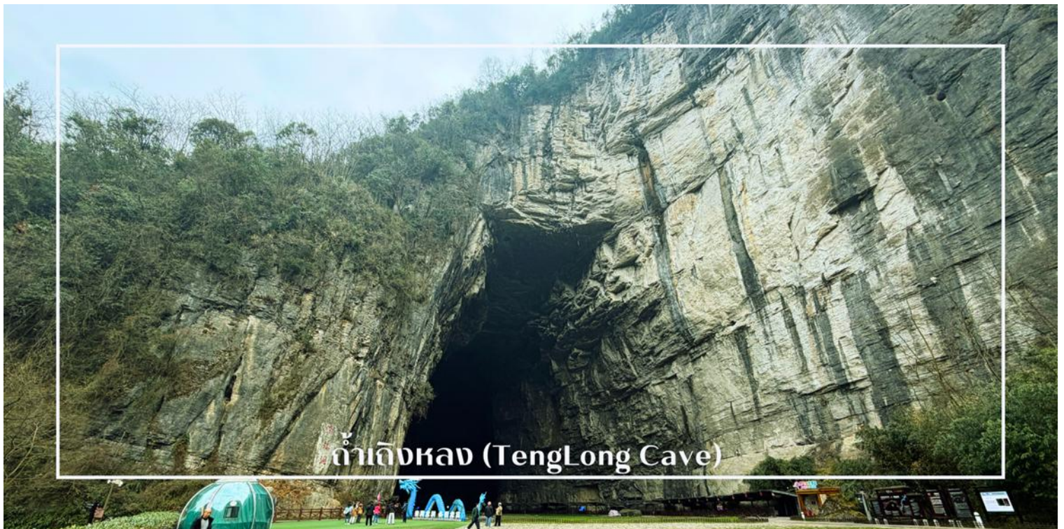
ถ้ำเถิงหลง (TengLong Cave)

นำท่านสู่ ถ้ำเถิงหลง (TengLong Cave) สถานที่ท่องเที่ยวระดับ 5A หนึ่งในถ้ำหินปูนที่ใหญ่และงดงามที่สุดของจีน ได้รับการขนานนามว่าเป็น ราชาน้ำค้างคาว ด้วยความอลังการของธรรมชาติที่ก่อกำเนิดมากกว่า 300 ล้านปี ตัวถ้ำมีความยาวมากกว่า 50 กิโลเมตร แบ่งออกเป็นถ้ำแห้งและถ้ำเปียก ภายในเต็มไปด้วยหินงอกหินย้อยรูปร่างแปลกตา โถงถ้ำสูงใหญ่โอ้อ่า มีลำธารใสไหลผ่านกลางถ้ำ ตลอดเส้นทางยังมีการจัดแสงสีตระการตา เพิ่มบรรยากาศเสมือนเดินทางอยู่ในดินแดนแฟนตาซี