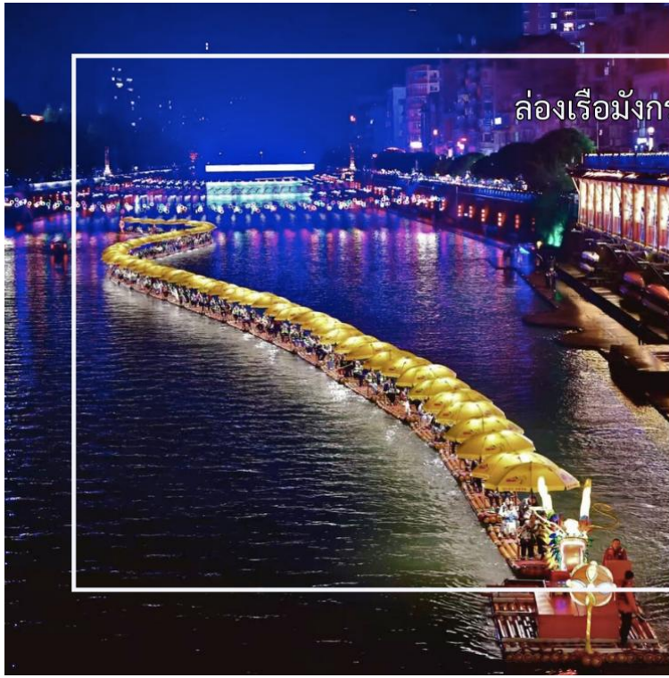
ล่องเรือมังกรแม่น้ำกิงสูย