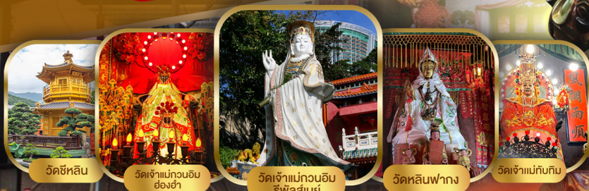
วัดซีหลิน วัดเจ้าแม่กวนอิม ย่องซ่า วัดเจ้าแม่กวนอิม ริวาสัสย วัดหลินฟาง วัดเจ้าแม่ทับทิม

ฮ่องกง บู๊จัดหนัก 9 วัดดัง สักการะ องค์เซกง องค์เก่าแก่ 600 ปี รับพลังงานดี ๆ 9 วัดดัง