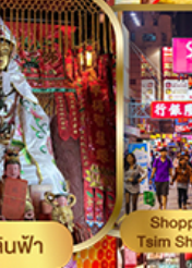
Shopping Tsim Sha Tsui