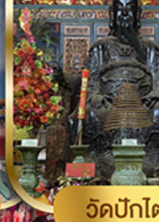
วัดปึกไต่