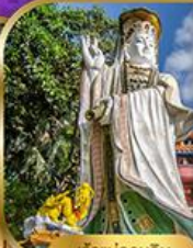
เจ้าแม่กวนอิม สวีลิสเบย์