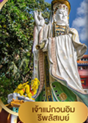
เจ้าแม่กวนอิม สวีลิสมย์