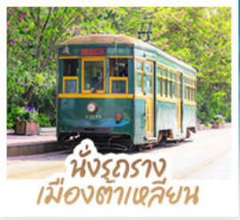
นั่งรถราง เมืองต้าเหลียน