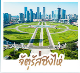
จัตุรัสชิงไฉ่