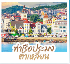
ทำเรือประมง ต้าเหลียน