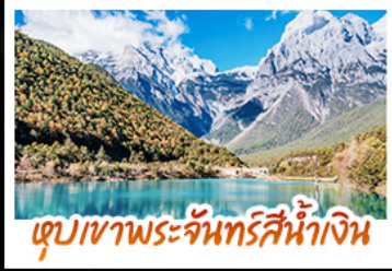
ทะเลสาบพระจันทร์สีน้ำเงิน