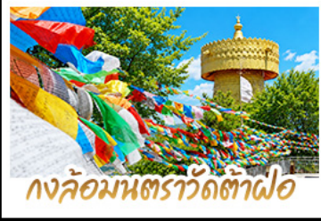
กองล้อมนตราวัดต้าฝอ

ถ่ายรูป MOOD ที่ใช้กับวิวทะเลสาบจอร์ให้สุดโรแมนติก • ชมดอกไม้ตามฤดูกาลกลางขุนเขา ณ สวนฮวงบูฉาง พืชตฤणाหิมะมังกรหยกความสูงกว่า 4,506 เมตร (รวมกระเช้าใหญ่ ไป-กลับ) • นั่งรถไฟชมวิวภูเขาหิมะมังกรหยก ชมวิวแบบพาโนรามา • เที่ยวเมืองโบราณต้าหลี่ ลี้จีย แซงกรี่ล่า ซิม ซ้อป เซะ กับวัดมณเฑียรขุนซางทิเบต ชมธารน้ำขาวไปสู่งด๊อ UNSEEN เมืองจิ้นแห่งขุนเขา • วัดลามะเซงจันหลิน สิบสี่สกุลอายุอารยธรรมทิเบต พอร์กับกงล้อมนตราที่ใหญ่ที่สุดในจีน • ซ้อปิ้งเฟลวิน ณ ถนนคนเดินหนานฉิงจี้ & POP MART