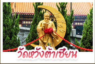
วัดเข่งต้าเซียน