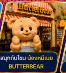
สนุกกับโซน น่องหมีเนย BUTTERBEAR