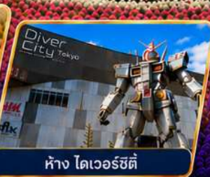
ห้าง ไดเวอร์ซิตี