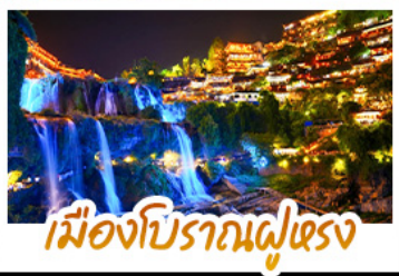
เมืองโบราณฝูเฉว่ง