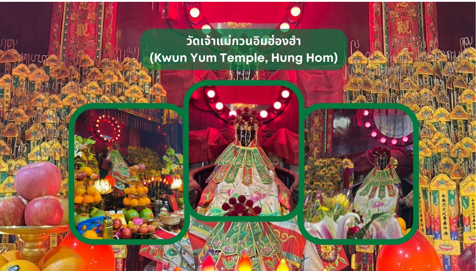
วัดเจ้าแม่กวนอิมฮ่องกง (Kwun Yum Temple, Hung Hom)

เช้า รับประทานอาหารเช้า ณ ภัตตาคาร บริการท่านด้วยเมนูติ่มซำฮ่องกง (มื้อที่ 3)