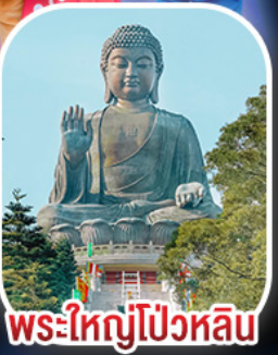
พระใหญ่โป่วหลิน