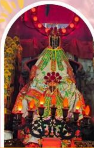
วัดเจ้าแม่กวนอิมฮ่องกง ขอพรเรื่องเงิน ทรัพย์สิน และความมั่งคั่ง