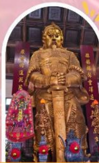
วัดแชกง ขอพรโชคลาก การเงิน และธุรกิจ