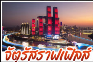
จัตุรัสราฟเฟิลส์