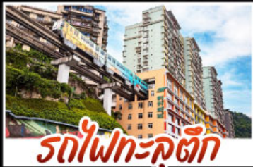
รถไฟฟ้าเคตึก