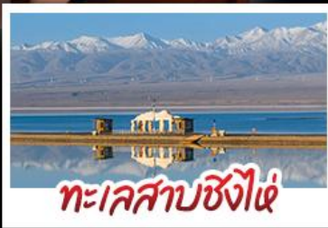
ทะเลสาบซิงไห่