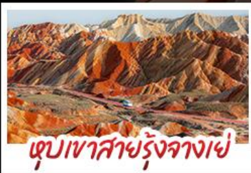
หุบเขาสายรุ้งจางเย่