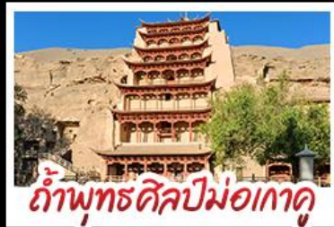
กำแพงพุทธรศิลป์ม่อเกาคู

เป็นทรายครวญ - สระน้ำวังพระจันทร์ ทะเลสาบเกลือฉาซ่า - กำพุทธรศิลป์ม่อเกาคู หุบเขาสายรุ้งจางเย่ - ทะเลสาบซิงไห่