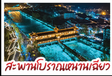
สะพานโบราณเขานางฟ้า