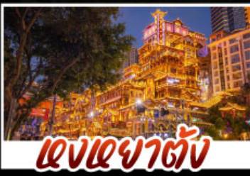
แสงอาคารฉิ่ง

สัมผัสประสบการณ์ที่ขงจินแบบเต็มอิ่ม ทั้งความล้ำสมัยของมหานครงฉิ่ง และความงดงามตระการตาของธรรมชาติที่อู่หลง ทุกการเดินทางเต็มไปด้วยความสะดวกสบายและคุ้มค่าเกินราคา!