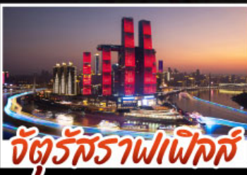
จัตุรัสราฟเฟิลส์