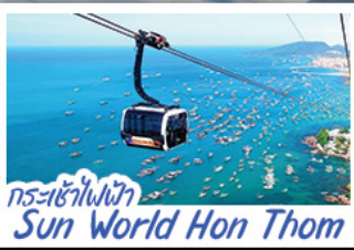
กระเช้าไฟฟ้า Sun World Hon Thom