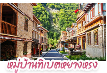
หมู่บ้านทิเบตสวยงามตรง

ตะลุยเจ็ดตุ๋น ต้ากู่ปิงชาน ชวนเซ็กคินแพนด้ายักษ์ พักใจที่หยดน้ำตาสีฟ้า! แวะชมเมืองโบราณลั่วไต้ สัมผัสมนต์เสน่ห์ หมู่บ้านทิเบตหยางหงซาต่อ สัมผัสความหนาวเย็นที่ อู๋ชานสวรรค์ธารน้ำแข็งต้ากู่ปิงชาน แหล่งรวมวิวหลักล้าน ตื่นตาไปกับแสงสียามค่ำคืน หยดน้ำตาสีฟ้า ณ สะพานหนานเฉียว เมืองตุ๋นเจียงเจียงน ก่อนปิดท้ายด้วยการช้อปปิ้งจุใจ ถนนชุนชู่-ไท่กู่หลี่ และเซ็กภาพกับ แพนด้ายักษ์ สดชื่น