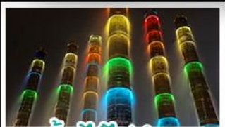
น้ำพุไม้ไผ่ตักSKP