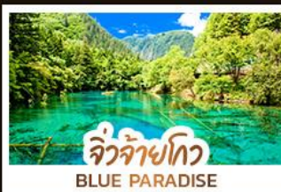
จิวจ้ายโกว BLUE PARADISE