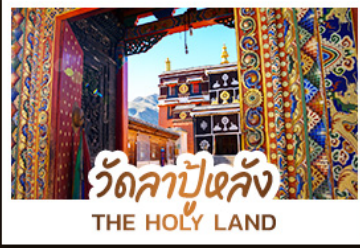
วัดลาปูหลง THE HOLY LAND

หนึ่งศรัทธา: สัมผัสความสงบและสถาปัตยกรรมทิเบตที่ วัดลาปูหลง หนึ่งผืนหญ้า: ล่องลอยไปในความเขียวจีของ ทุ่งหญ้ากานหนาน หนึ่งสายน้ำ: ค้นพบความงามเหนือกาลเวลาที่ จิวจ้ายโกว