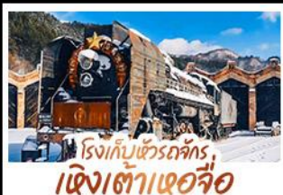
โรงเก็บข้าวรถจักร, เจิงเต่าเออจื่อ