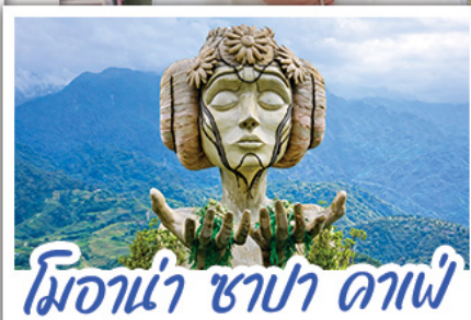
ไมอาน่า ซาปา ดาเฟ