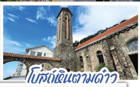
โบสถ์หินตามด้าว