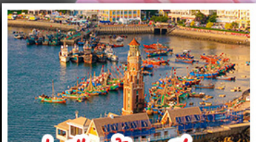
ท่าเรือต้าเหลียน