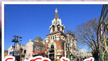
โบสถ์โกธิคต้าเหลียน