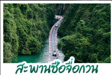
สะพานซื่อจื่อกวน