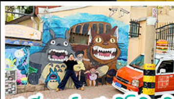
สตรีทอาร์ต สตุตโตอิจิบลิ