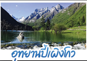
อุทยานปี้เฉิงโกว