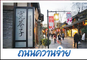
ถนนควานจ้าย