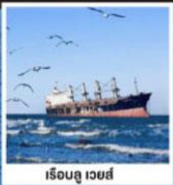
เรือลู เวย์ส