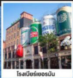
โรงเบียร์เยอรมัน