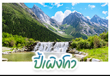
ปีติงโกว