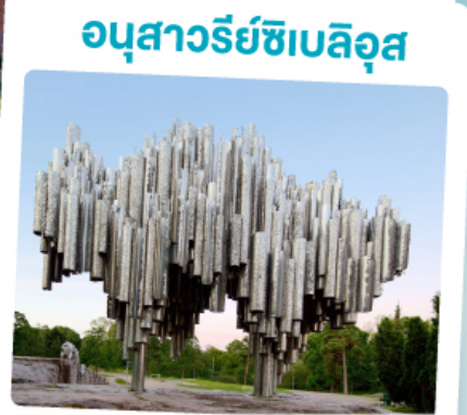
อนุสาวรีย์ซีเบลึส

เที่ยว 4 ประเทศยุโรปเหนือและกลุ่มบอลติก พร้อมแวะเที่ยวมหานครเซี่ยงไฮ้