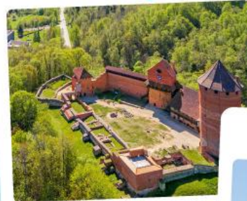
ปราสาทไครด้า