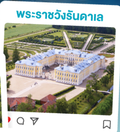
พระราชวังรินคาล