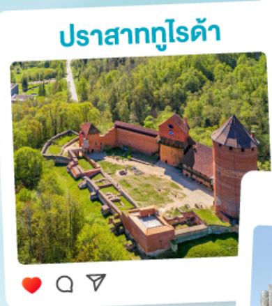
ปราสาทกูโรด้า