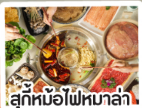
สุกี้ยี่วไฟหม่าล่า