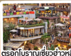
ตรอกโบราณเซียวฮ่าวหลี่