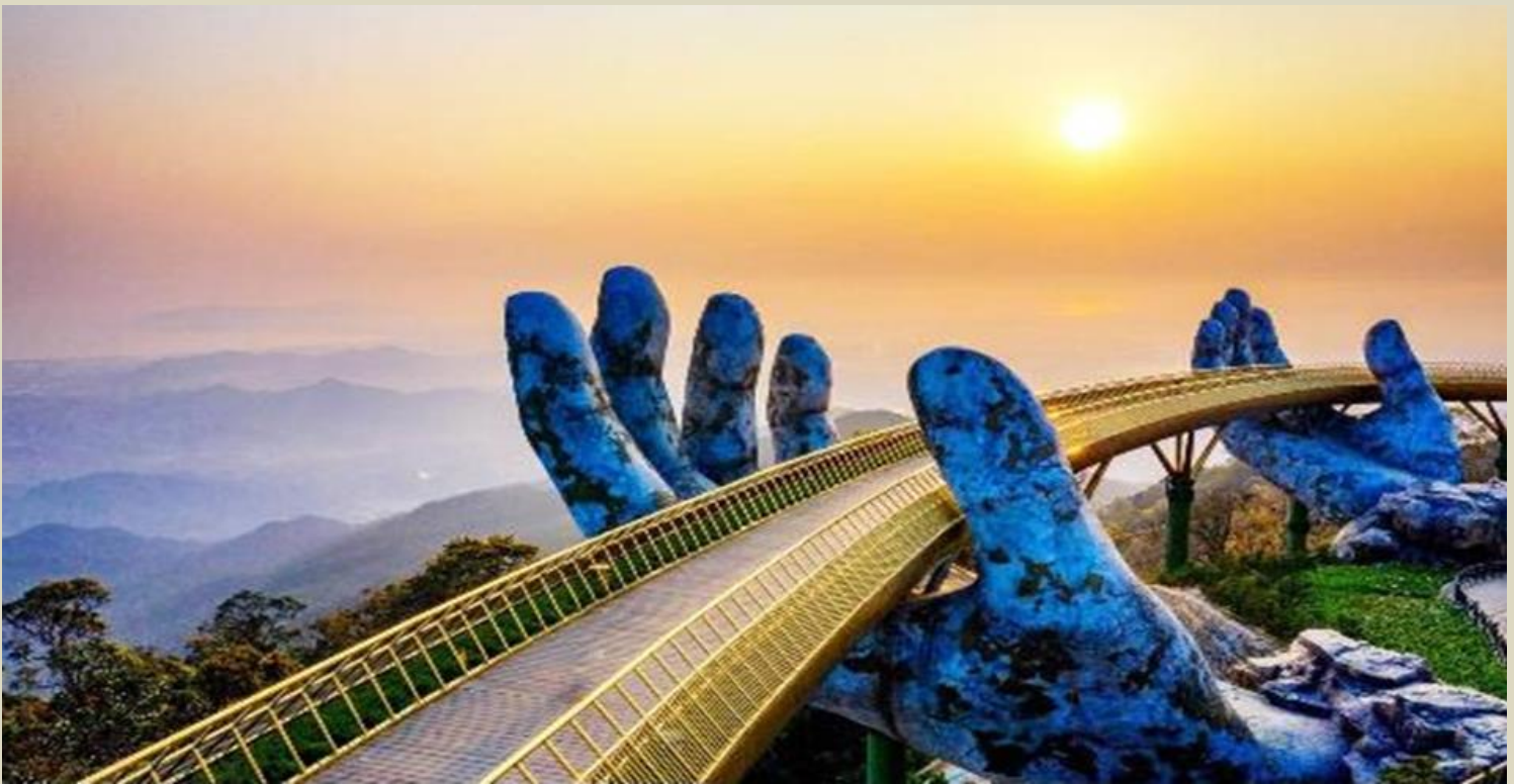
2UDAD-EK006 เวียดนามกลาง ดานัง ฮอยอัน บานาฮิลล์ พัก 3 เมือง 4 วัน 3 คืน โดยสายการบิน Emirates Airline (EK)