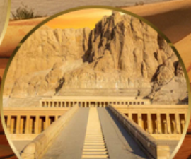
หุบเขากษัตริย์