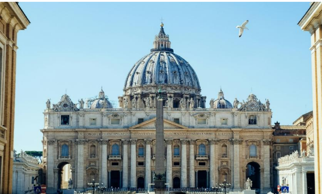
มหาวิหารนักบุญปีเตอร์ (ST. PETER' BASILICA)

(กรณีมีพิธีด้านใน หรือถ้าหากมีผู้เข้าชมเป็นจำนวนมากจนไม่สามารถเข้าชมได้ทันเวลา ทั้งนี้เพื่อมิให้กระทบต่อกำหนดการท่องเที่ยวอื่นๆ ภายในโปรแกรมทัวร์" อาจจะไม่ได้รับการเข้าชม)