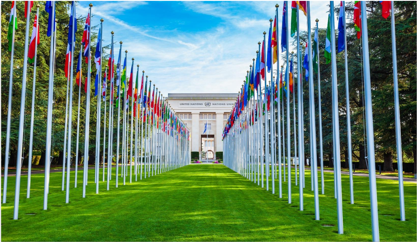
UNITED NATIONS OF GENEVA

สหประชาชาติ เจนีวา (United Nations of Geneva) เป็นหนึ่งในสำนักงานภูมิภาคที่สำคัญขององค์การสหประชาชาติ ตั้งอยู่ภายในอาคาร Palais des Nations ใจกลางนครเจนีวา ประเทศสวิตเซอร์แลนด์ อาคารแห่งนี้มีสถาปัตยกรรมแบบโรมันประยุกต์ (Neoclassical) อันโดดเด่น สร้างขึ้นในช่วงต้นคริสต์ศตวรรษที่ 20 เพื่อเป็นที่ทำการของ องค์การสันนิบาตชาติ (League of Nations) ซึ่งเป็นองค์กรระหว่างประเทศรุ่นก่อนของ