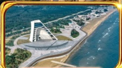
หอดอยกาลเวลา