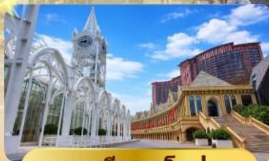
ระเบียงยุโรป