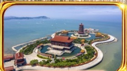
จุดชมวิว 8 เซียน