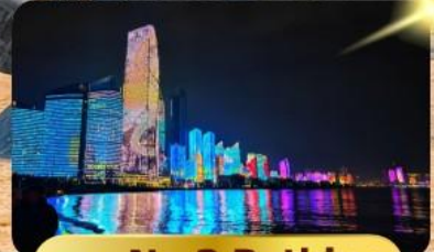
หาด No.3 Bathing

เมนูพิเศษ ซาบูสายพาน 6 วัน 4 คืน เดินทาง : พฤษภาคม 69