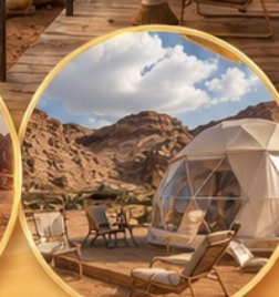
แคมป์กลางทะเลทราย