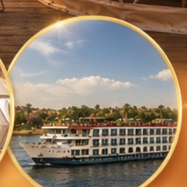
ล่องเรือแม่น้ำไนล์