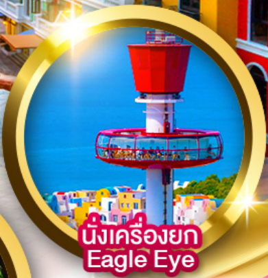
นั่งเครื่องยก Eagle Eye