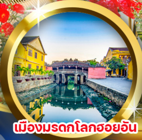
เมืองมรดกโลกฮอยอัน