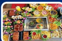
“ปิ้งย่าง BBQ”