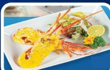
“กุ้งมังกรอบซีส”

บุฟเฟ่ต์นานาชาติบนบานาฮิลล์ 2 มื้อ บุฟเฟ่ต์ BBQ ปิ้งย่าง+ชาบู ซีฟู้ด พร้อมกุ้งมังกร ลิ้มลอง อาหารเวียดนาม แหม่มเมือง ต้นตำหรับ