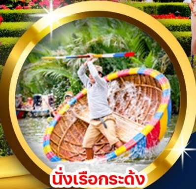
นั่งเรือกระด้ง

“บานาฮิลล์เมืองเทพนิยายฝรั่งเศส สัมผัสธรรมชาติภูเขา สายหมอก สวนดอกไม้ นั่งกระเช้ายาวที่สุดในโลก ชมสะพานมือสีทอง ส่องเรือกระด้งหมู่บ้านกิมทาน เดินเล่นชมเมืองมรดกโลกฮอยอัน”