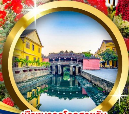
เมืองมรดกโลกฮอยอัน