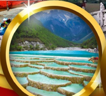
ทะเลสาบไต้สูยเหอ