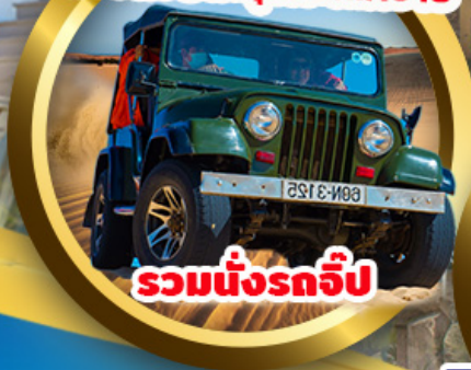
รวมนั่งรถจี๊ป