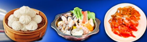
เสี่ยวหลงเปา+เปิดปักกิ่ง+สุกิมองโกล