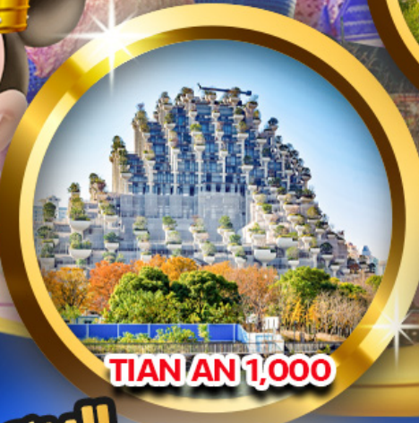
TIAN AN 1,000