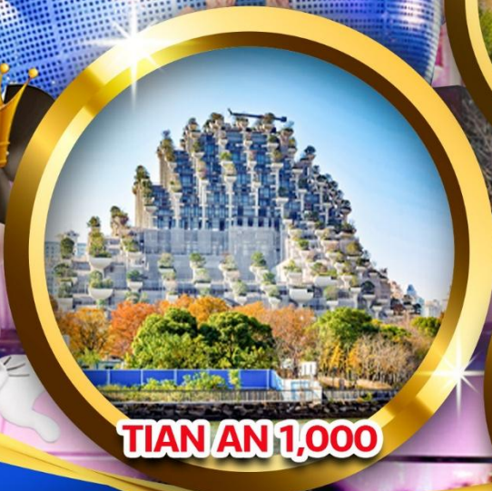
TIAN AN 1,000