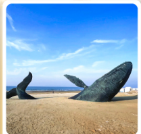
วาฬผู้โดดเดี่ยว